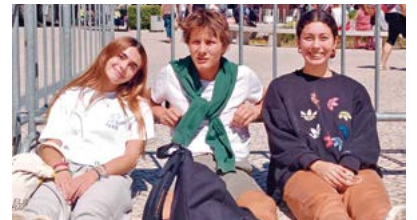
L'Amanda, amb jersey negre, amb altres joves

«Durante la Jornada Mundial de la Juventud fuimos testigos de eventos únicos que nos dejaron una gran impresión. Dos experiencias destacan sobre todo en mi peregrinación. En primer lugar, la magnitud de personas congregadas fue asombrosa. Miles de jóvenes de todo el mundo se reunieron para ver al Santo Padre, pero también para compartir su amor por Cristo, creando una atmósfera de espiritualidad y fe incomparable.